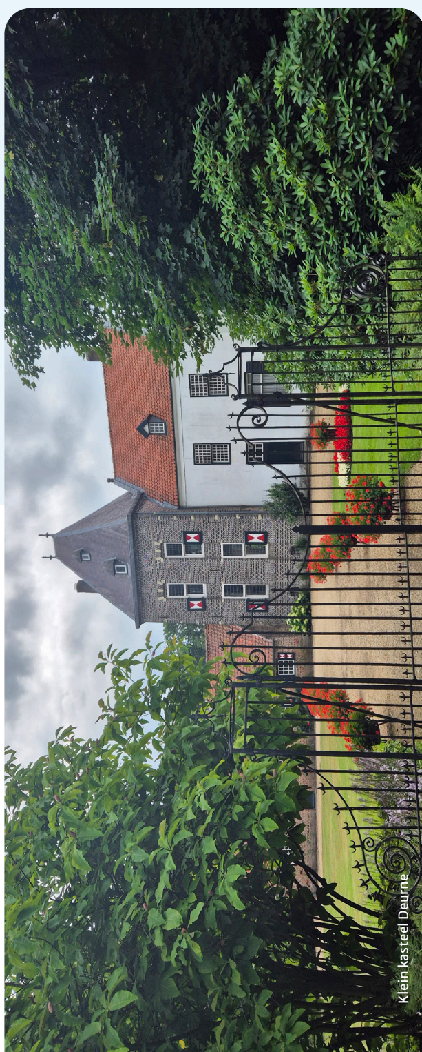
Klein kasteel Deurne

Eind- en pauzepunt: station Helmond Brouwhuis, diverse gelegenheden nabij.