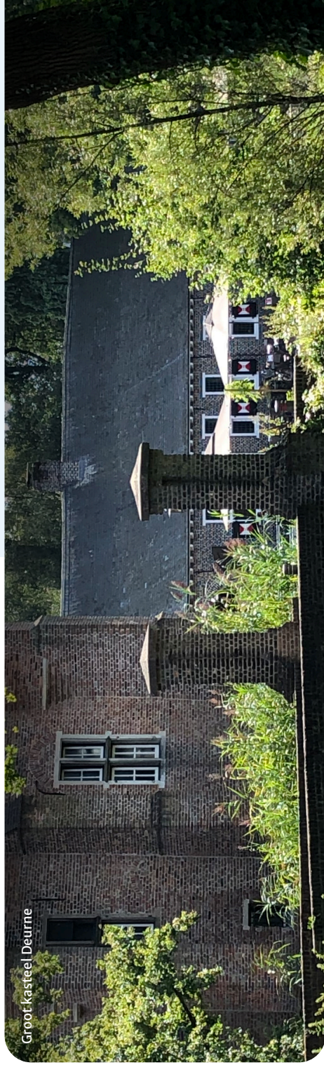
Groot kasteel Deurne