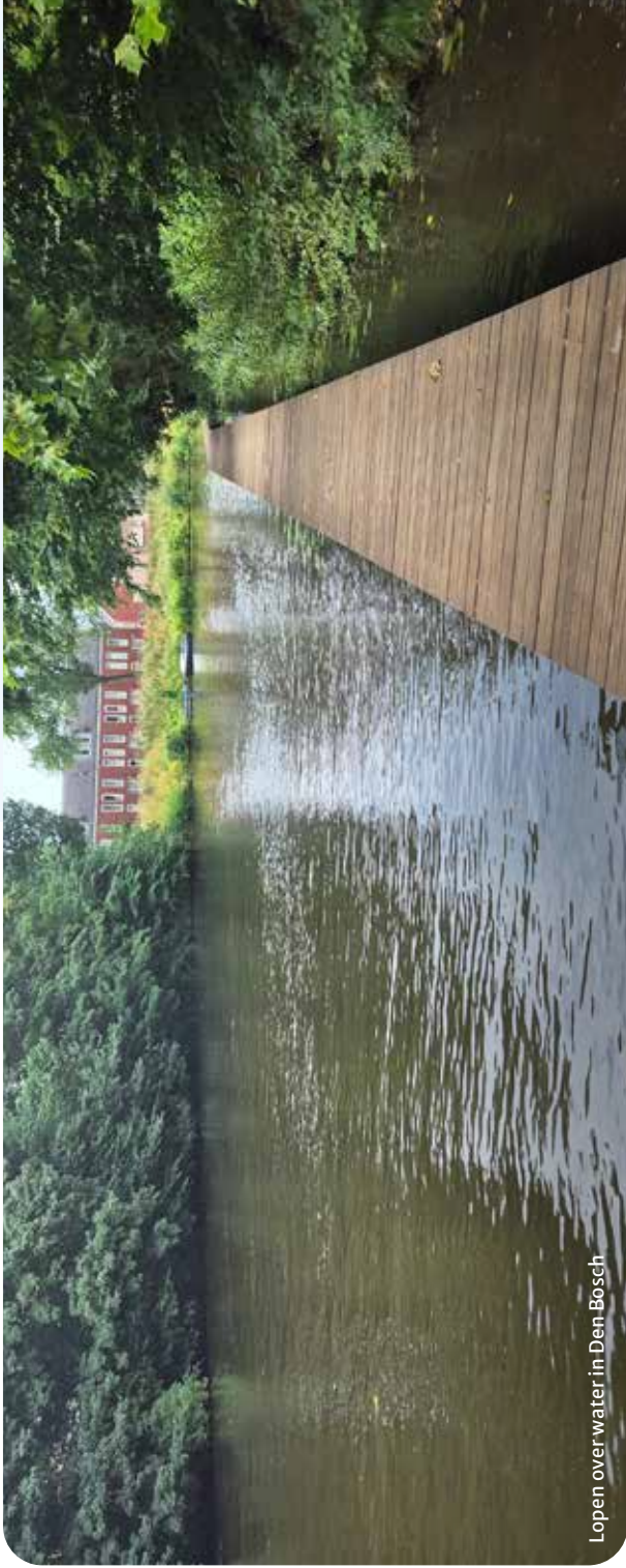
Lopen over water in Den Bosch

Verlaat de Citadel aan de overzijde. Pad met de bocht mee naar links volgen (Je loopt langs de Zuid-Willemsvaart). Bij brug, wegoversteken en LA .