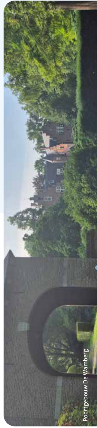
Poortgebouw De Wamberg

Pleisterplaats: Boekhandel Adr. Heijnen Kerkstraat 27, s-Hertogenbosch