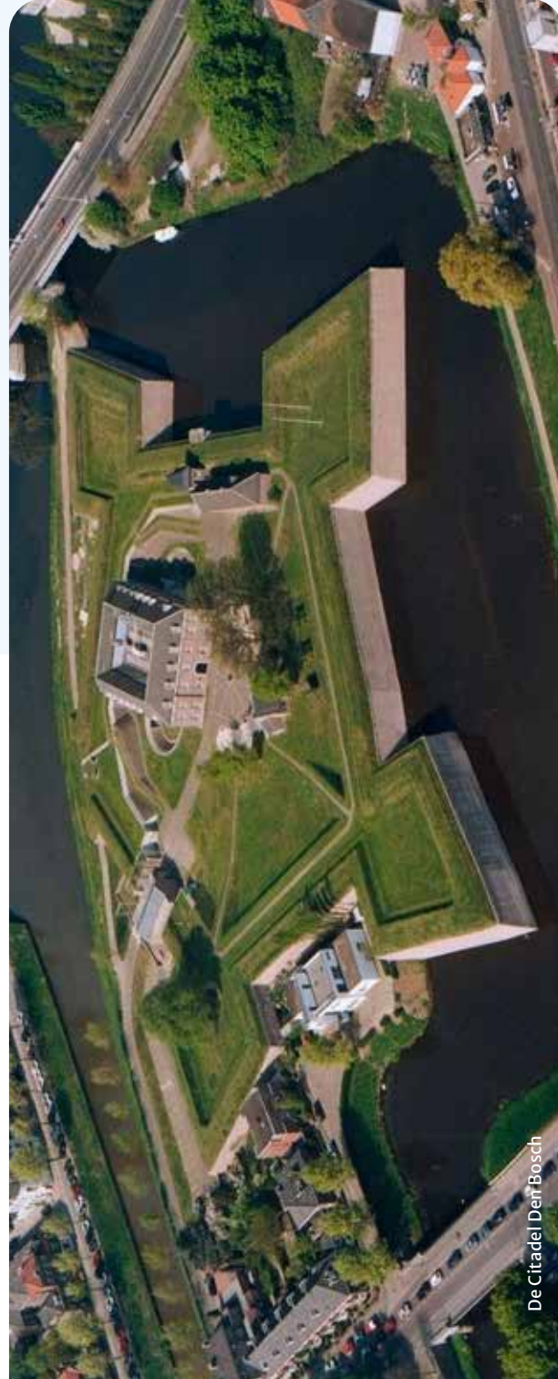
De Citadel Den Bosch

Kennispunt: Het Kruithuis is het enige overgebleven kruitmagazijn uit de Tachtigjarige Oorlog in Nederland. Een unieke plek om naar een goed verhaal te luisteren over de Tachtigjarige Oorlog in de Zuidelijke Nederlanden. En over de hoofdrol die water speelt in en bij de vesting Den Bosch.