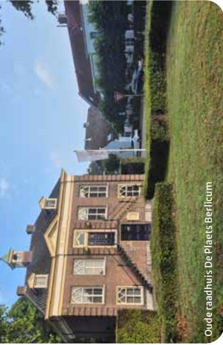
Oude raadhuys De Plaets Berlicum