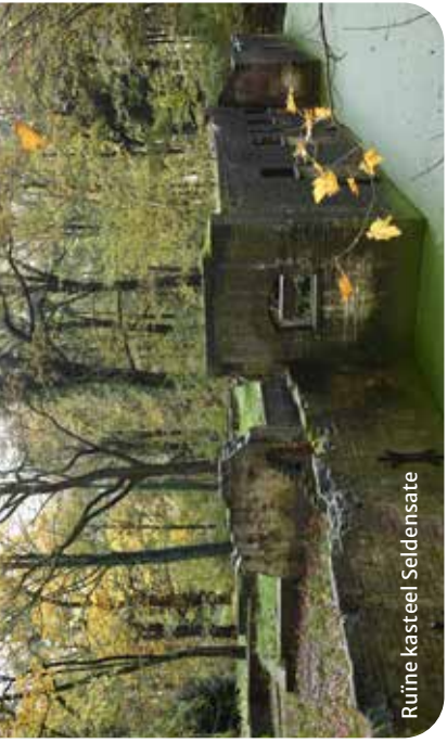
Ruïne kasteel Seldensate