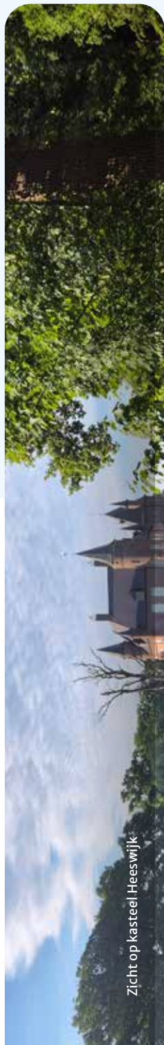
Zicht op kasteel Heeswijk

Pleisterplaats: Proeflokaal Abdij van Berne Abdijstraat 49, Heeswijk-Dinther